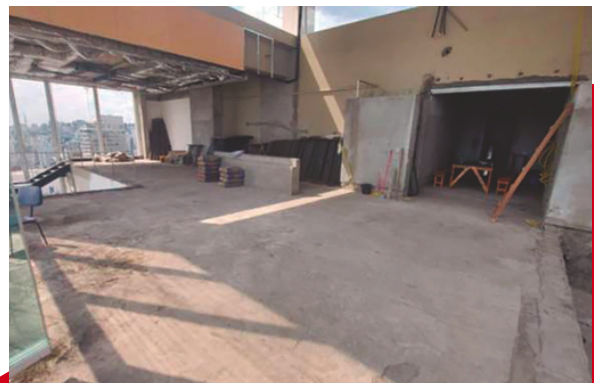
Troca de piso