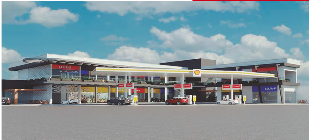
Visual perspectiva frontal