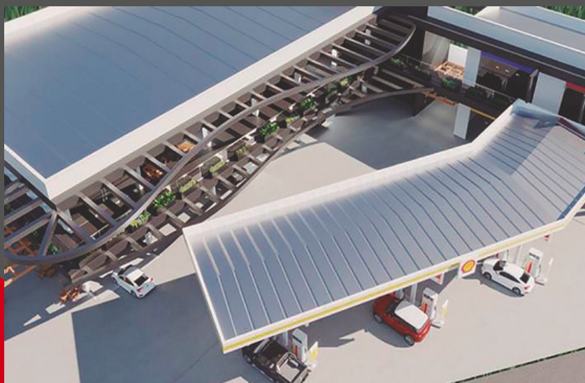
Visual perspectiva superior