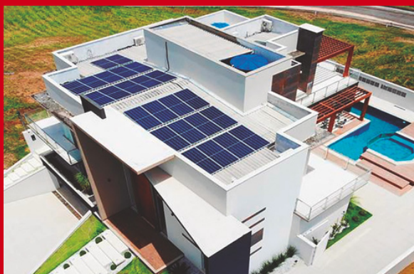
Vista perspectiva superior

Construção de Residência de Alto Padrão, 515 m 2 de área construída. Localizado no Condomínio Ipiranga, Marabá, Pará.