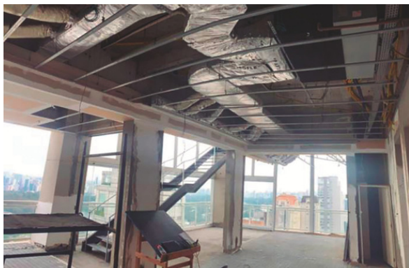
Execução de forro e manutenção do sistema de refrigeração

Reforma de Apartamento de Alto Padrão (Cobertura). Localizado no bairro Ibirapuera, São Paulo.