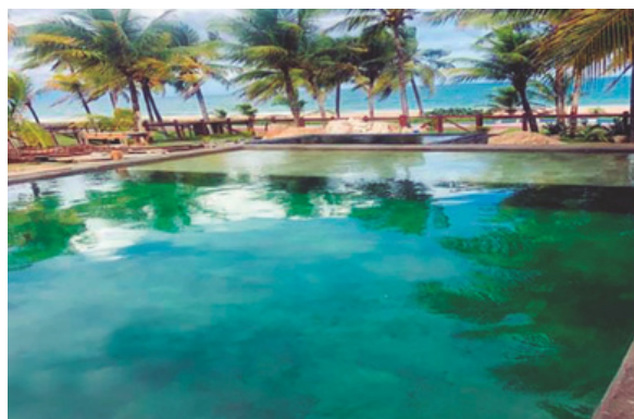
Teste de Estanqueidade