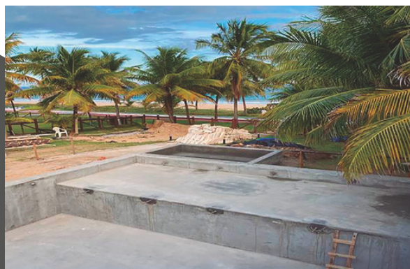
Etapa de fundações e impermeabilização da piscina

Reforma e ampliação de Residência de Alto Padrão. Localizado no Condomínio Paraíso, Salvador, Bahia.